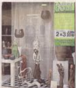
Les vitrines du bourg jouent le jeu avant l'exposition de ce week-end.