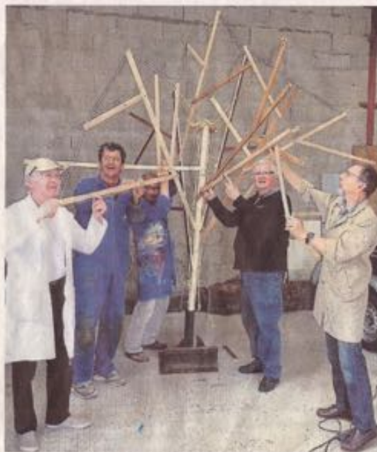
La création de l'arbre aux tissus demande un peu de mise œuvre par des bénévoles impliqués depuis de nombreux mois pour la réussite de cette huitième édition d'1 jardin 1 artiste.