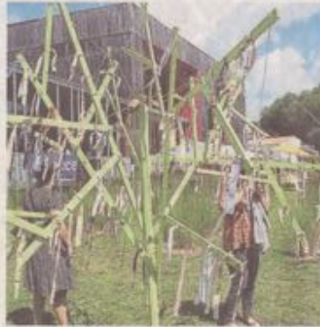
Les spectateurs invités à accrocher un bout de tissus dans l'arbre aux tissus.

Pour tous les exposants et les jardiniers qui les accueillent, cette première est une belle satisfaction. Une première, car le parcours change à chaque exposition bisannuelle. Elle permet de belles rencontres entre ar-