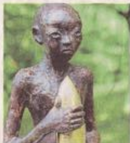
Des œuvres à découvrir dans les jardins privés ou public au gré d'un circuit piétonnier.

Mauves-sur-Loire — Un circuit piétonnier à travers les jardins permettra de découvrir, samedi et dimanche, les œuvres de vingt-cinq sculpteurs et plasticiens.